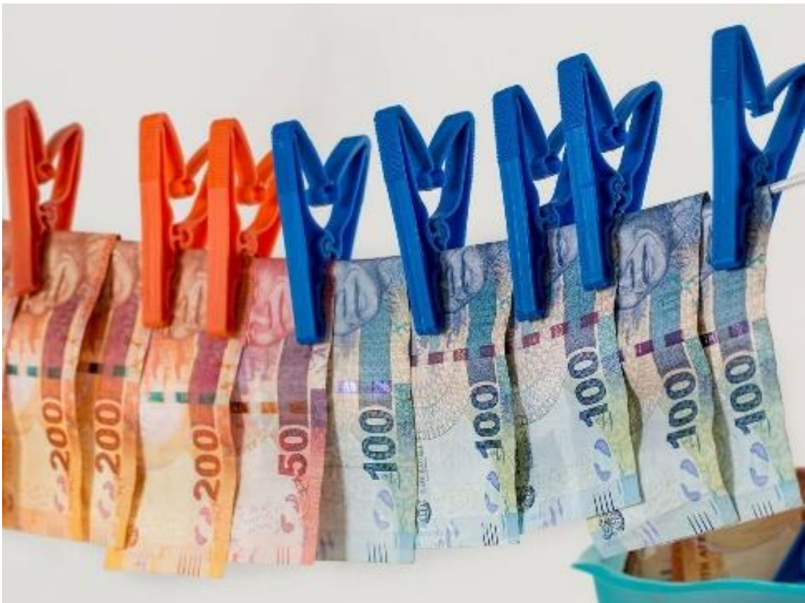
Lavado de dinero.

En todos los países miembros, los ciudadanos creen que está aumentando la corrupción, y que los gobiernos no hacen lo suficiente para impedirlo